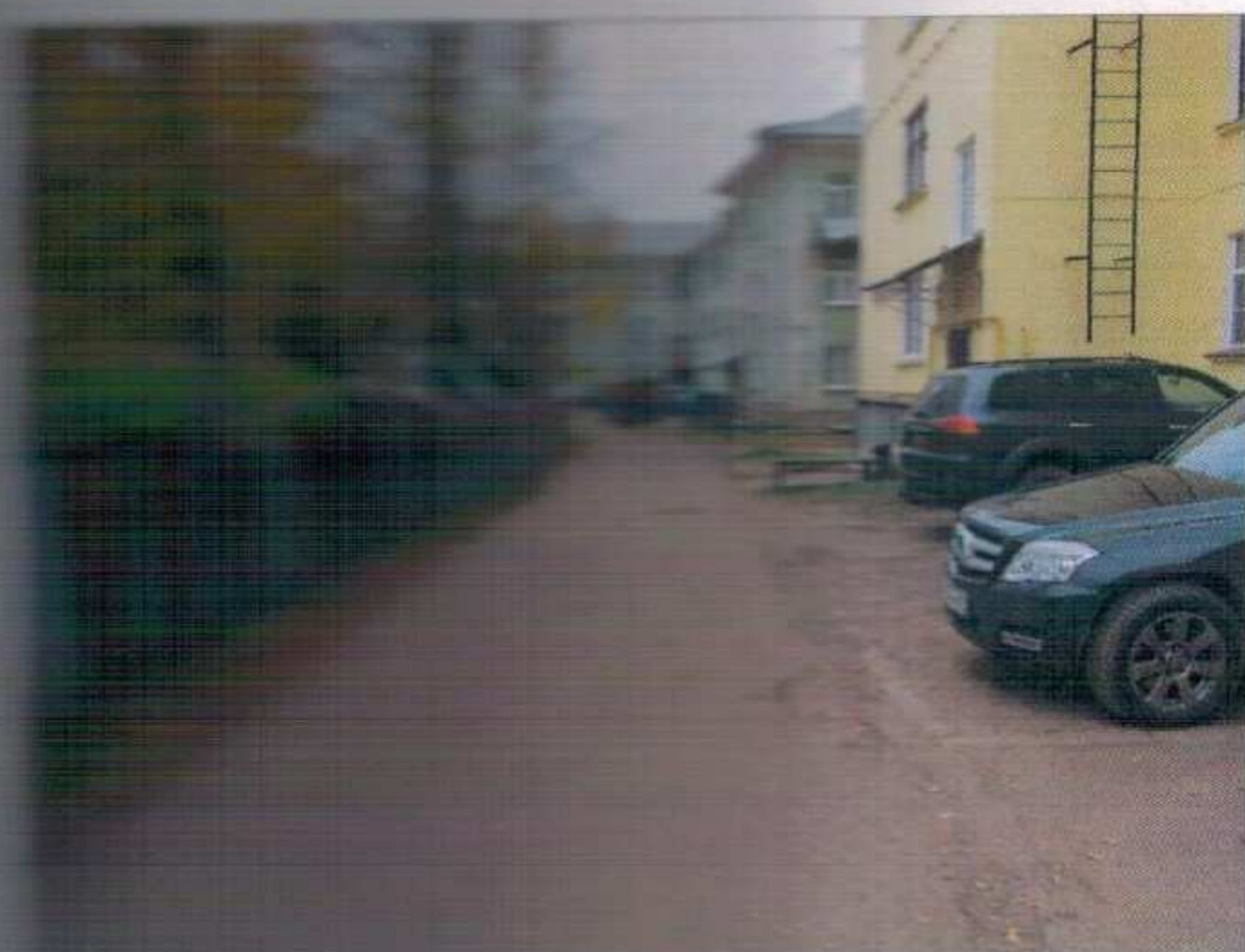
Фото №1 – Подъезд к объекту