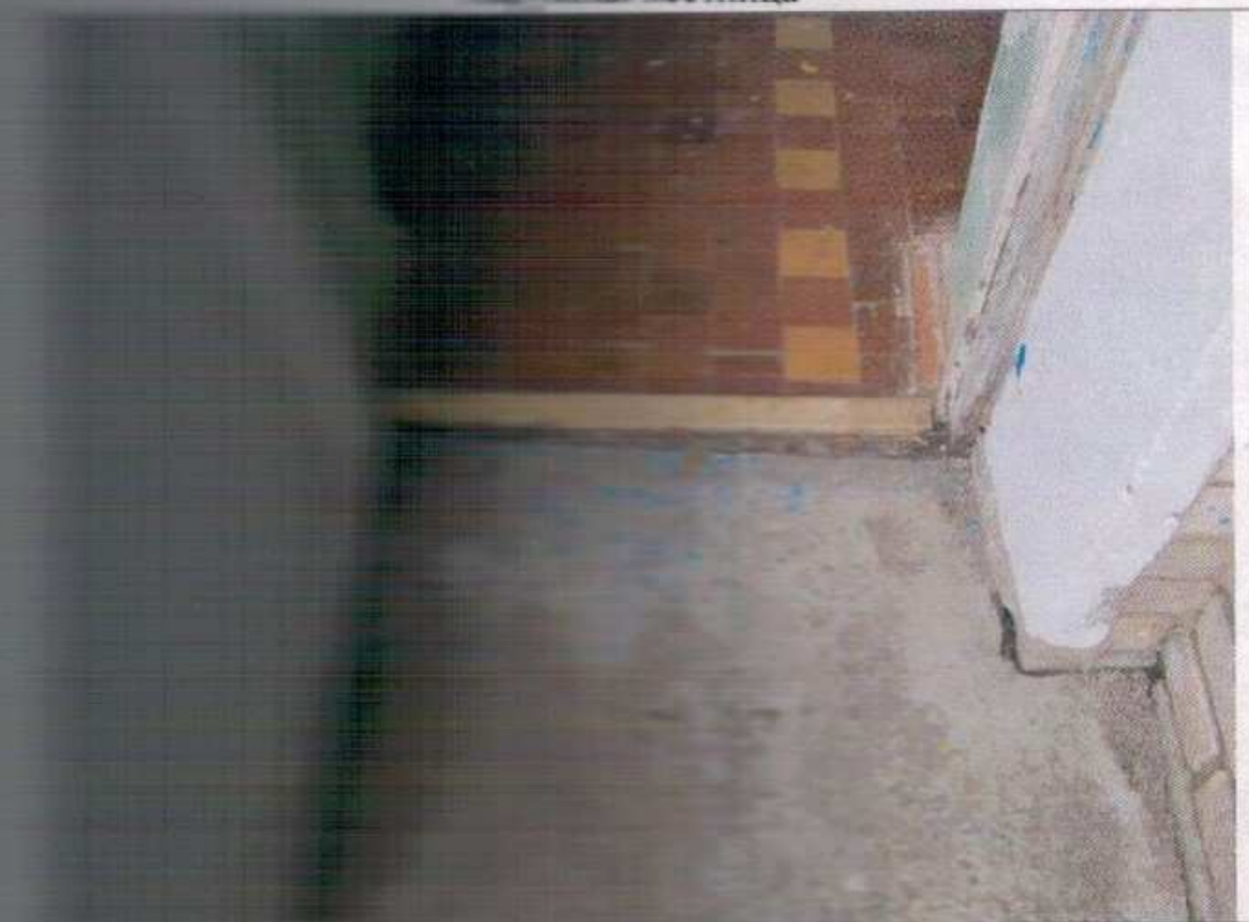
Отдельный вход в группу расположенную на первом этаже. Внутренняя дверь