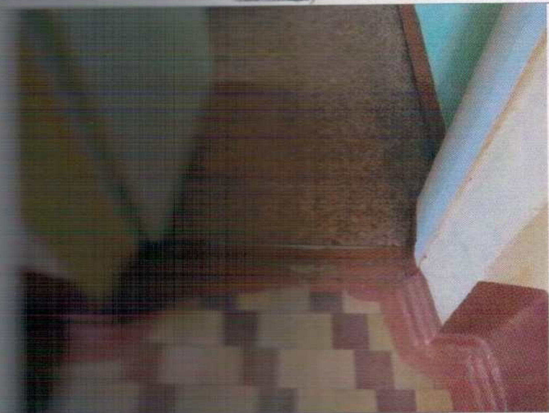
Фото №15 – Внутренние двери