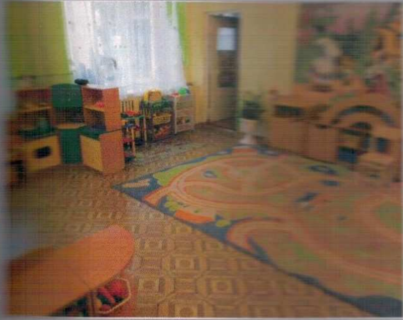
Фото №19 – Зона целевого назначения здания (Зальная форма обслуживания)