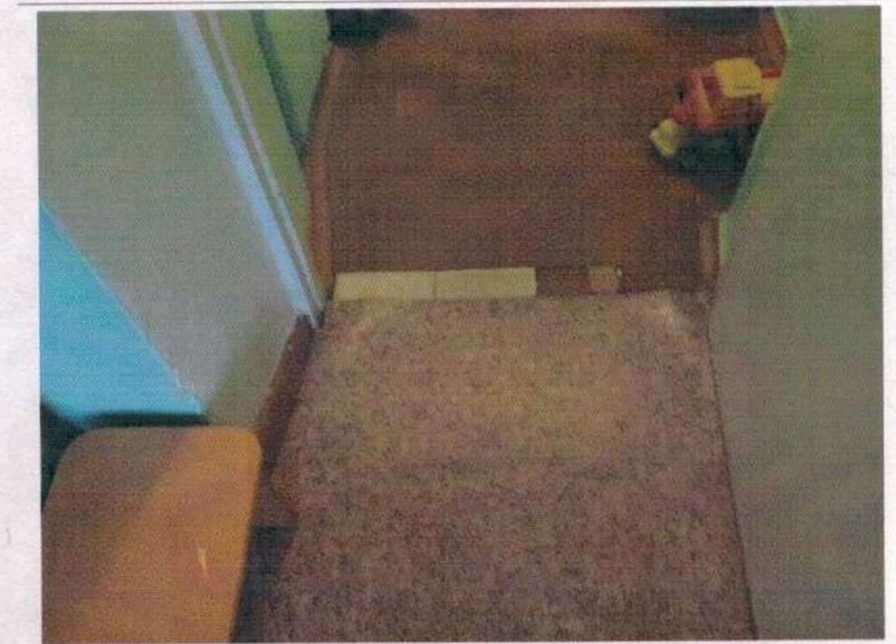
Фото №18 – Внутренние двери