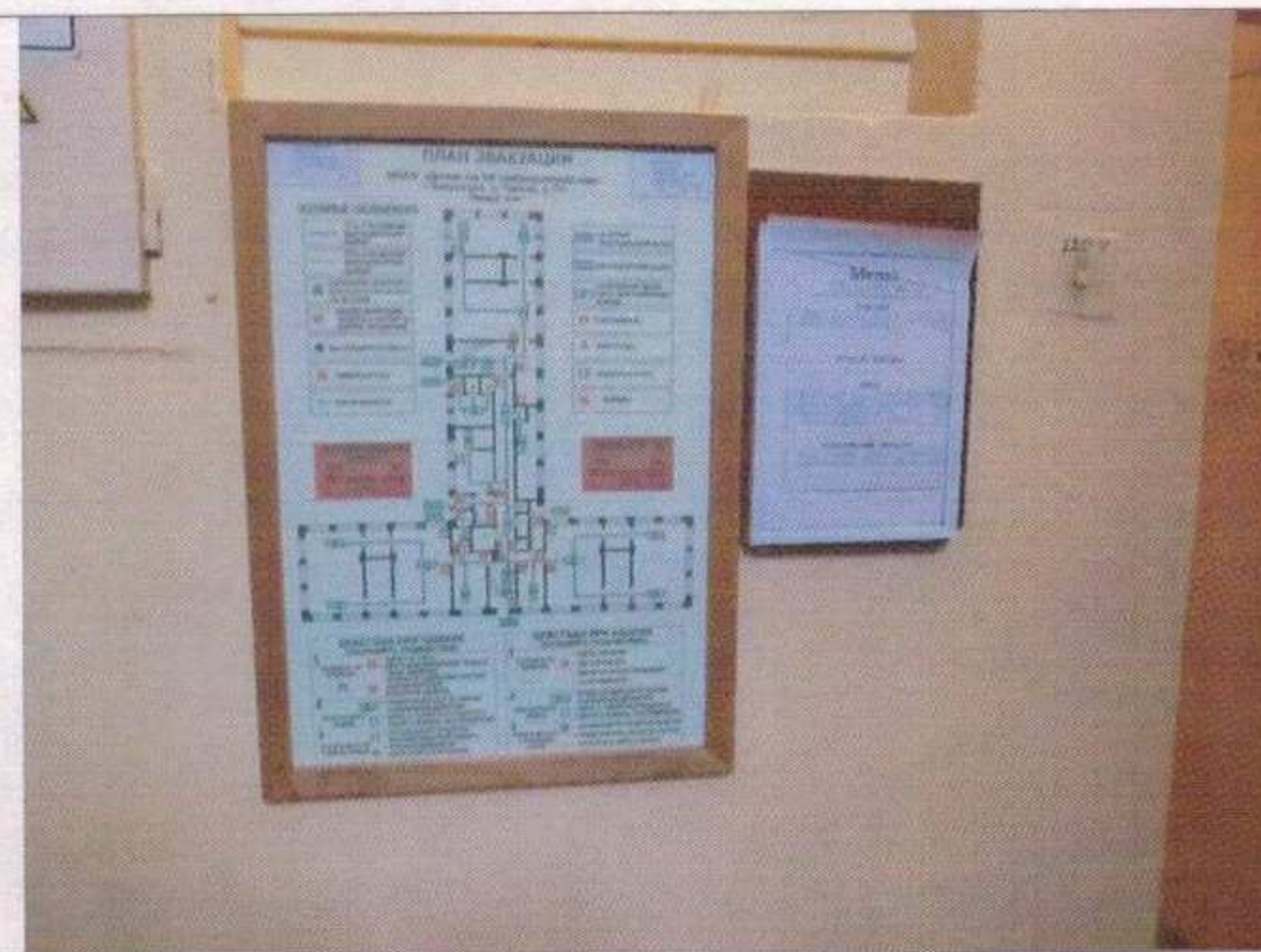
Фото №28 - Система информации