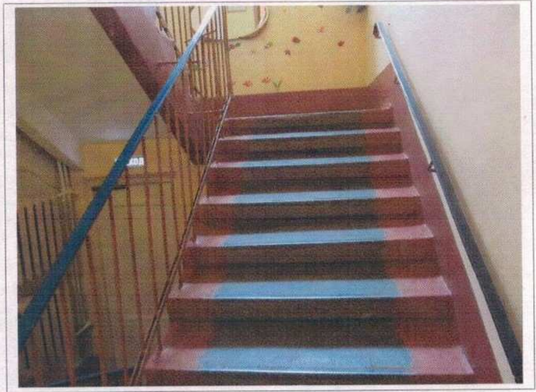
Фото №14 – Путь (пути) движения внутри здания (внутренние лестницы)