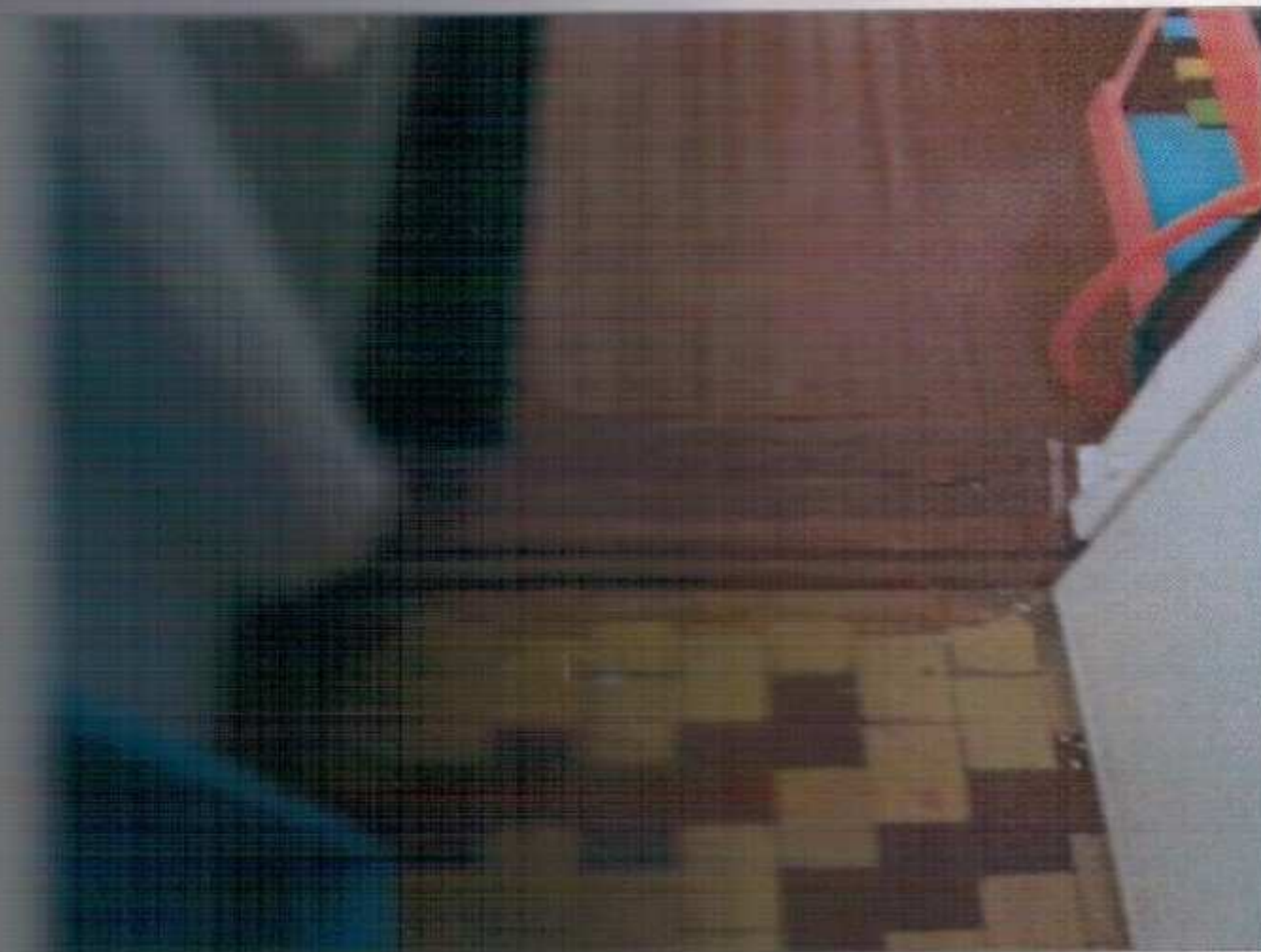
Фото №17 – Внутренние двери