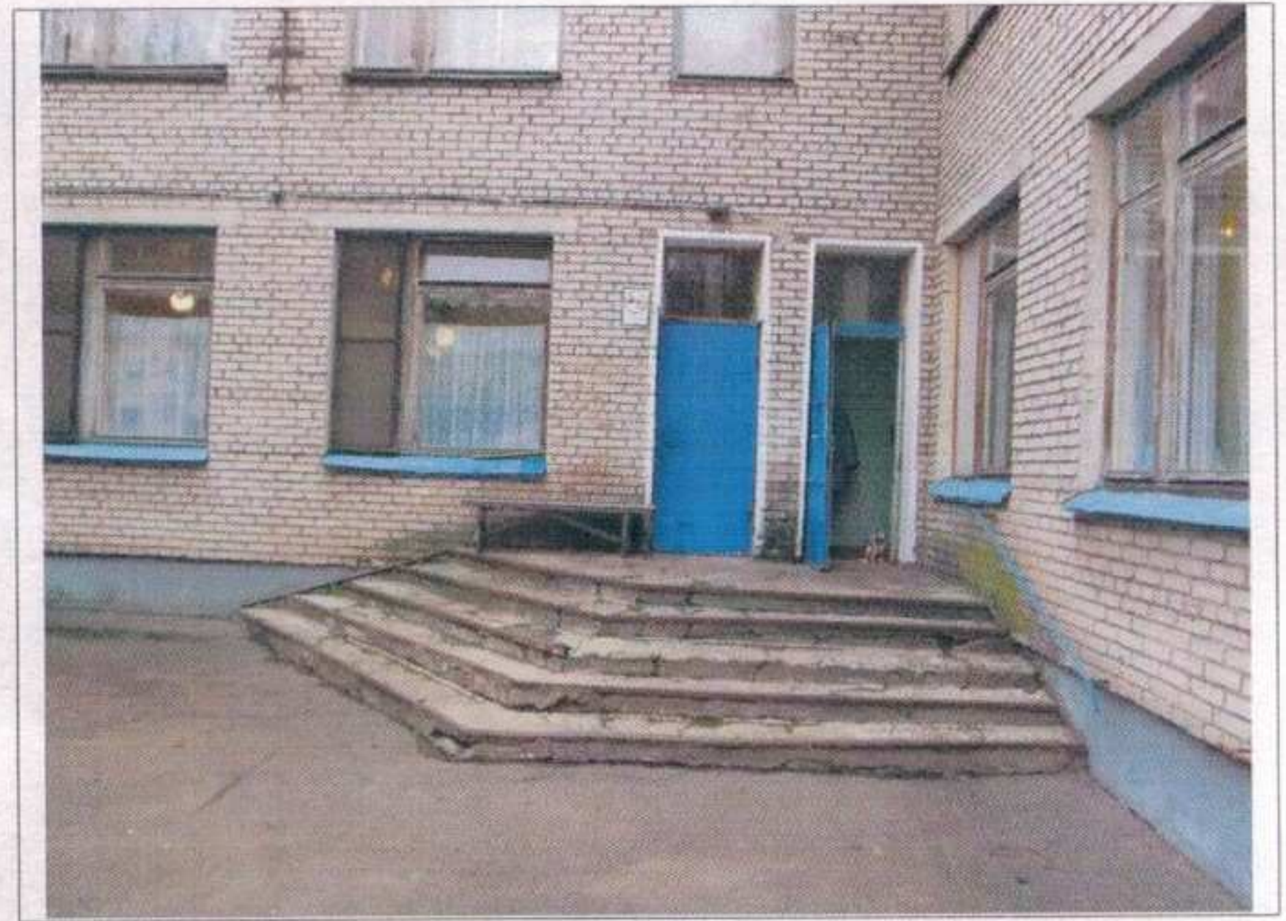
Фото №8 - Отдельные входы в группы расположенные на первом этаже