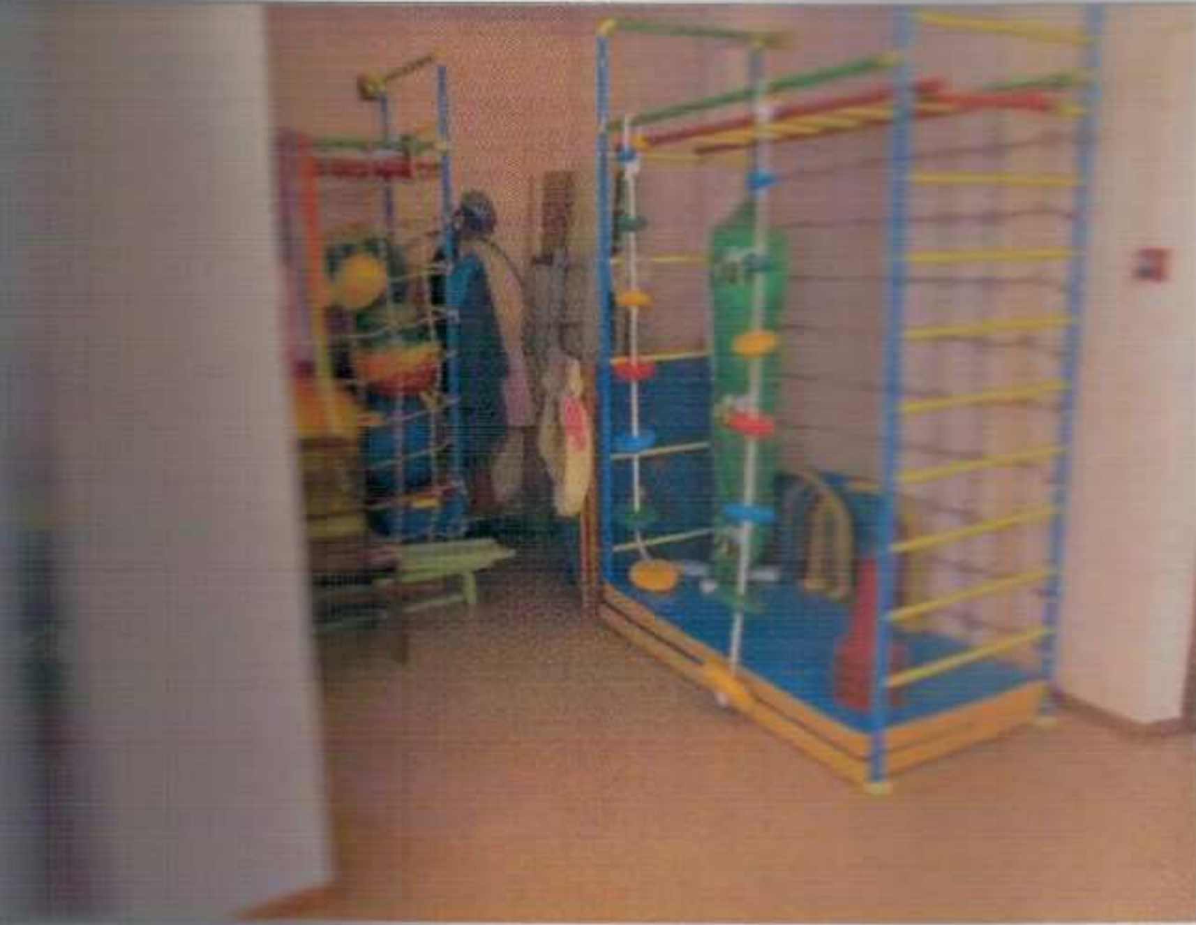
Фото №21 – Зона целевого назначения здания (Зальная форма обслуживания)