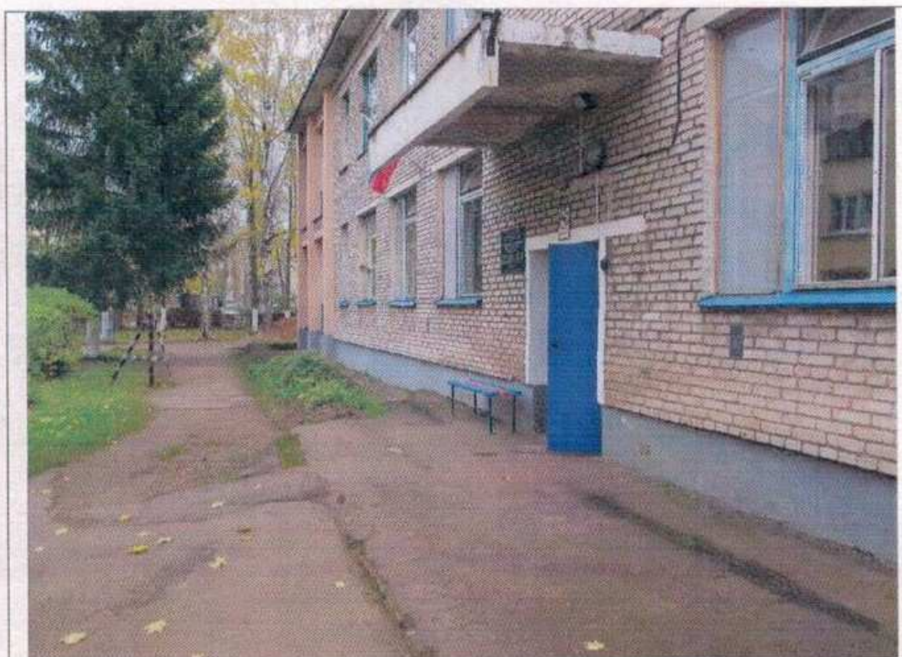
Фото №4 – Главный вход