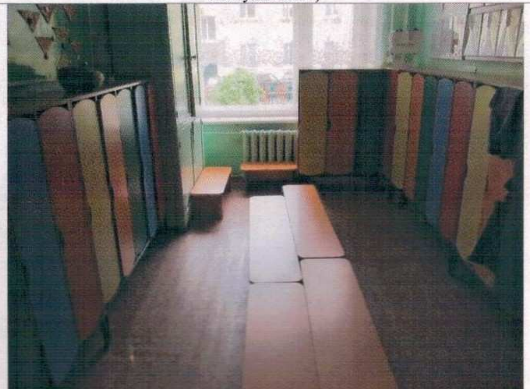
Фото №24 – Гардероб