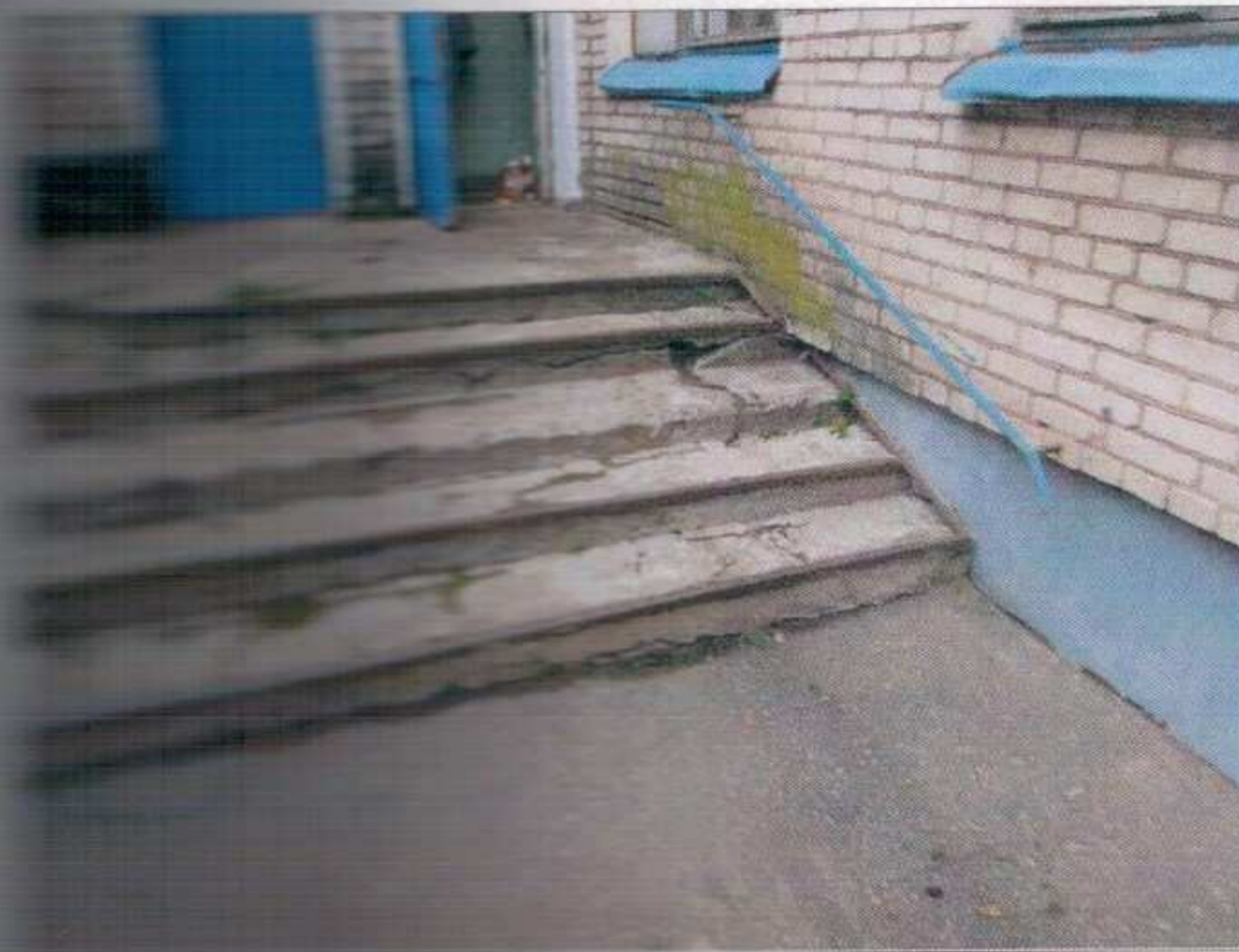
Отдельный вход в группу расположенную на первом этаже. Наружная лестница