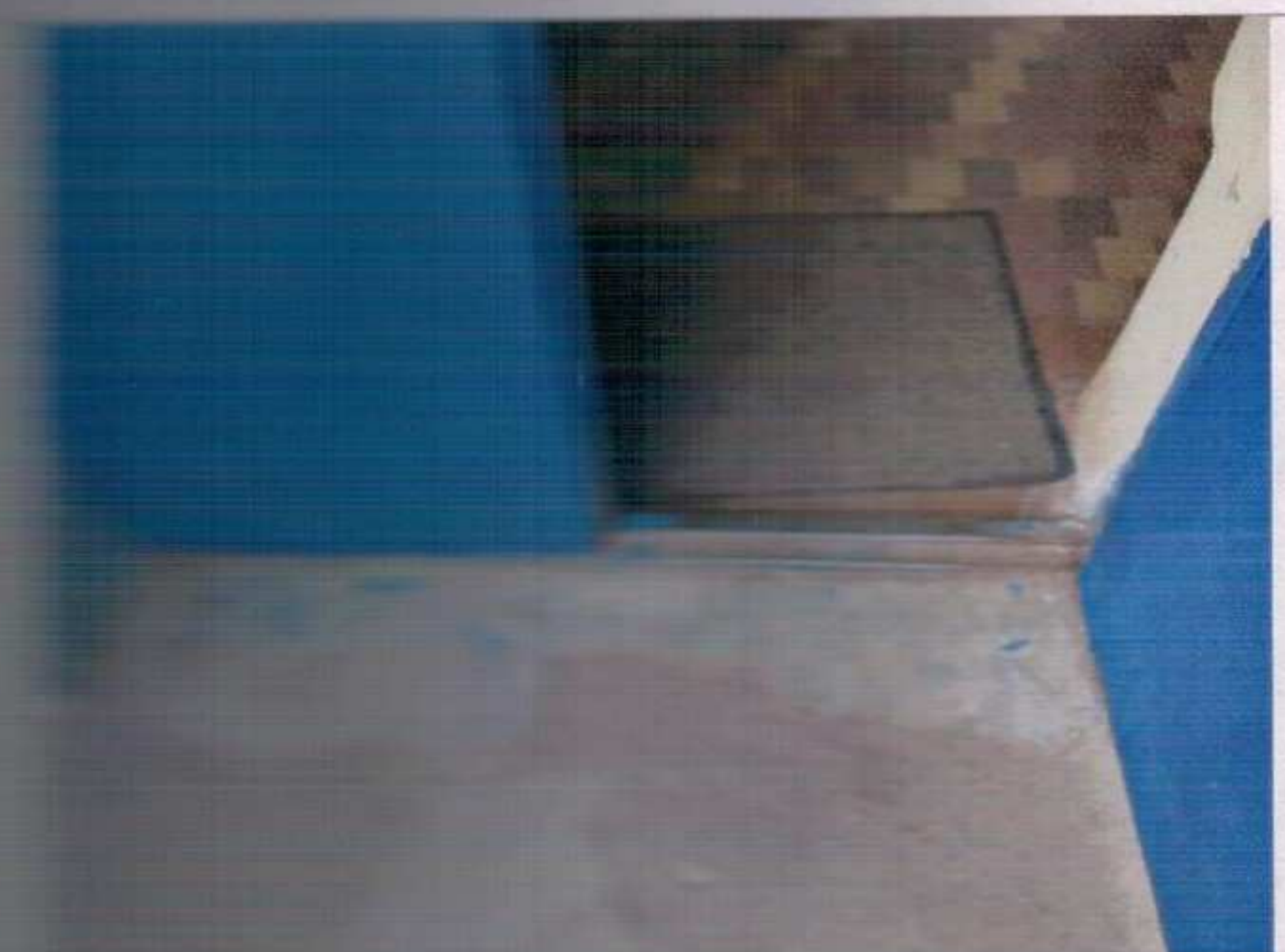
Фото №5 – Поврежденная входная дверь