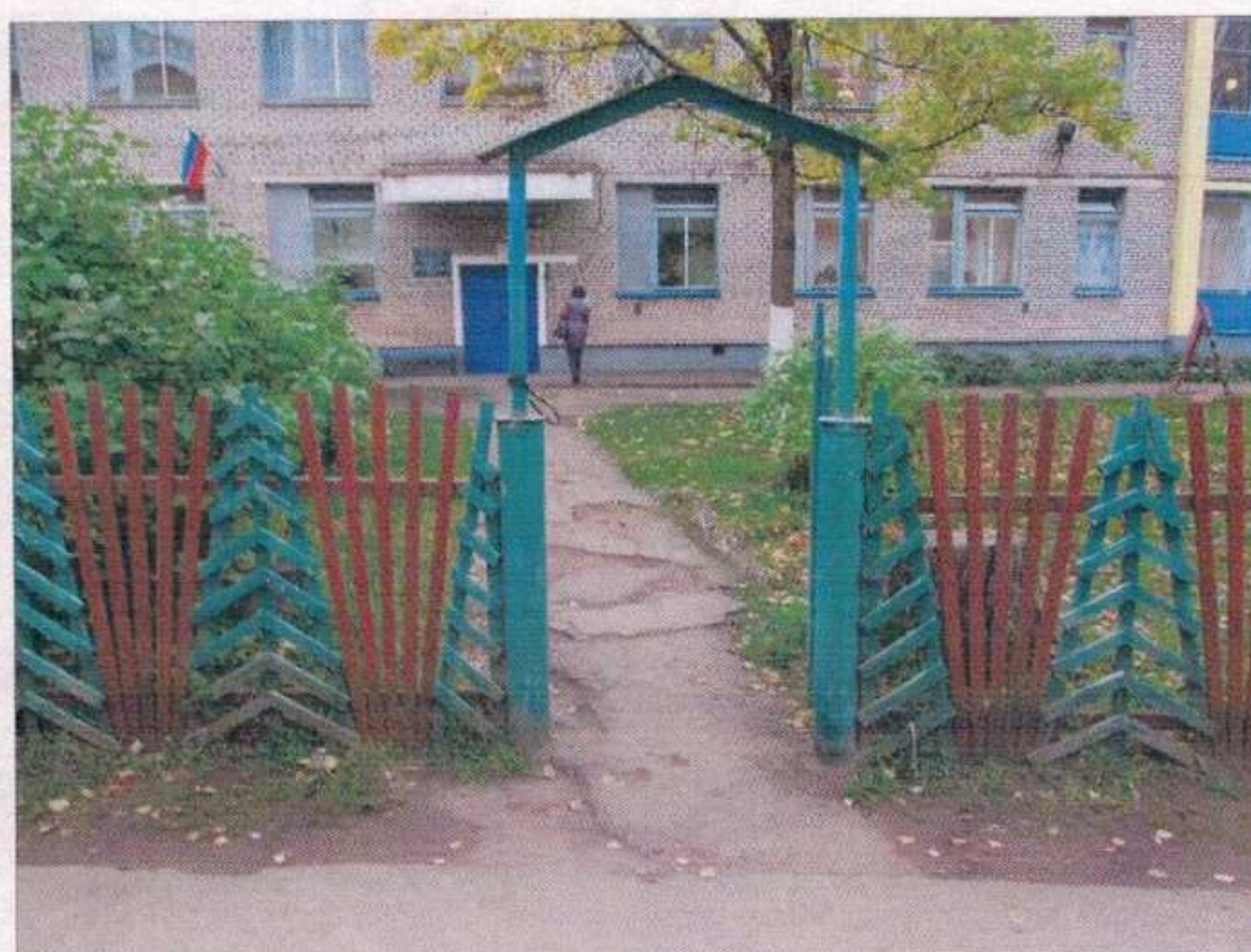
Фото №2 – Вход на прилегающую территорию