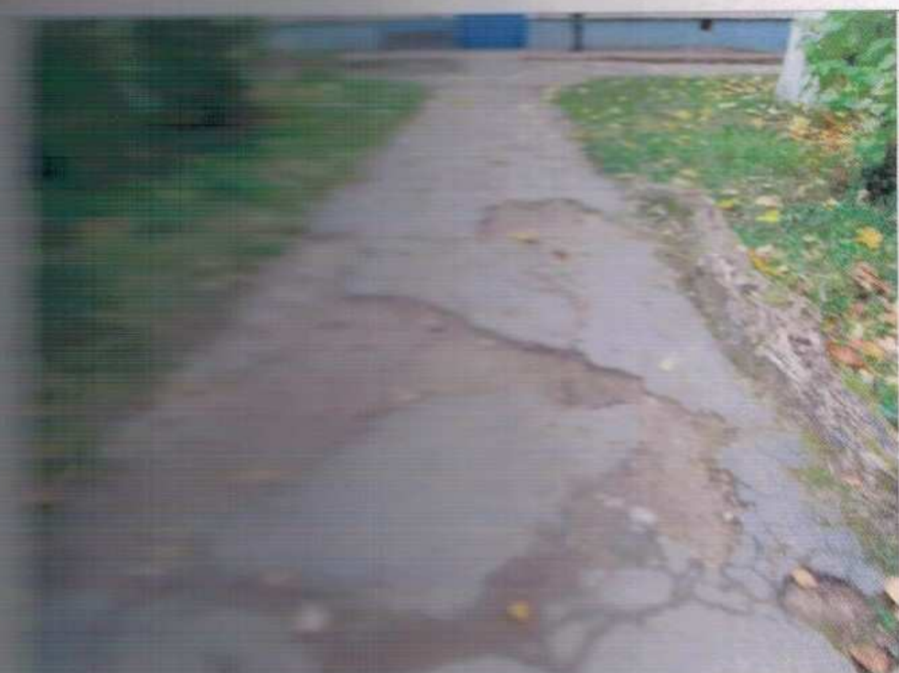
Фото №3 – Поврежденная территория