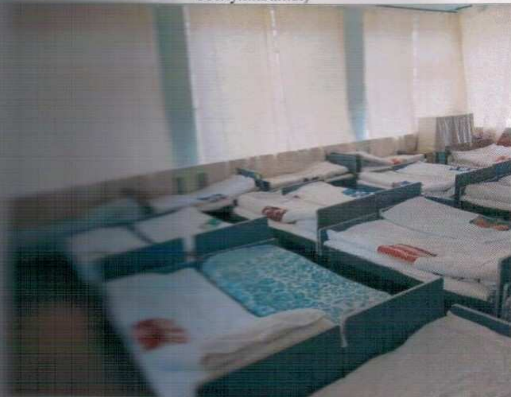
Фото №23 – Зона целевого назначения здания (Зальная форма обслуживания)