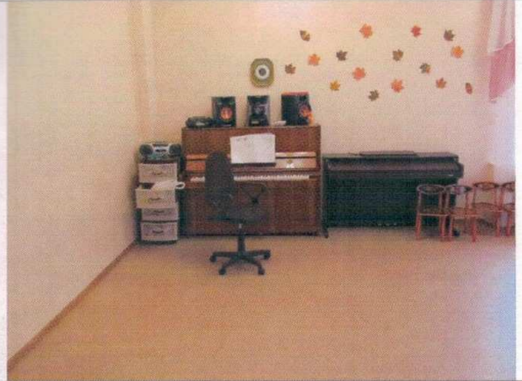
Фото №22 – Зона целевого назначения здания (Зальная форма обслуживания)