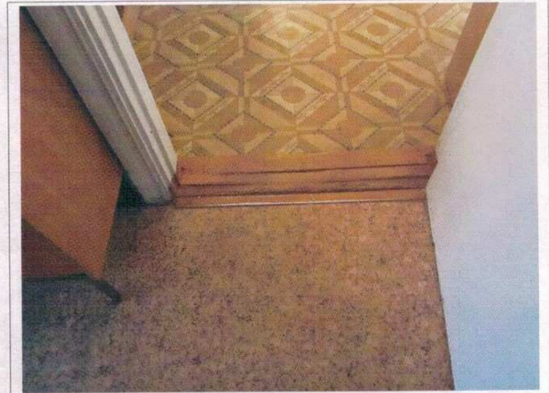
Фото №16 – Внутренние двери