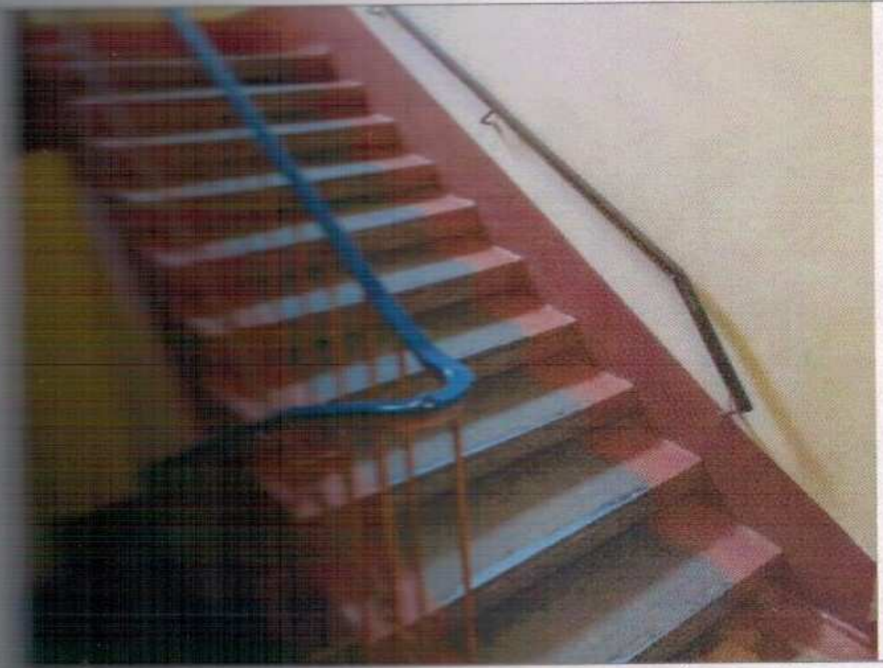
Фото №13 – Путь (пути) движения внутри здания (внутренние лестницы)