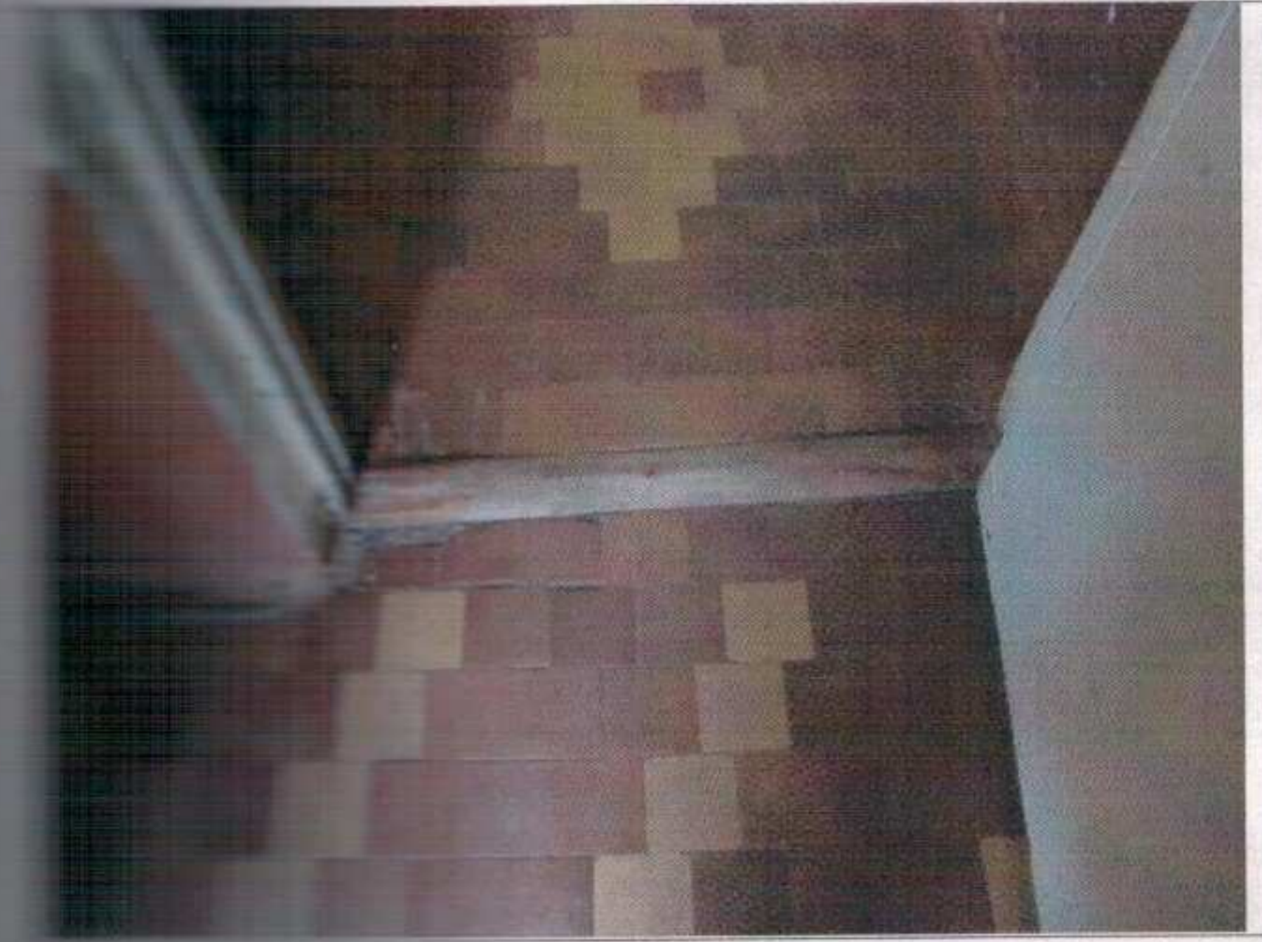
Фото №7 – Внутренняя входная дверь