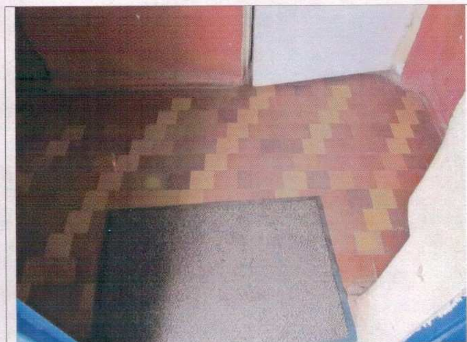
Фото №6 – Тамбур