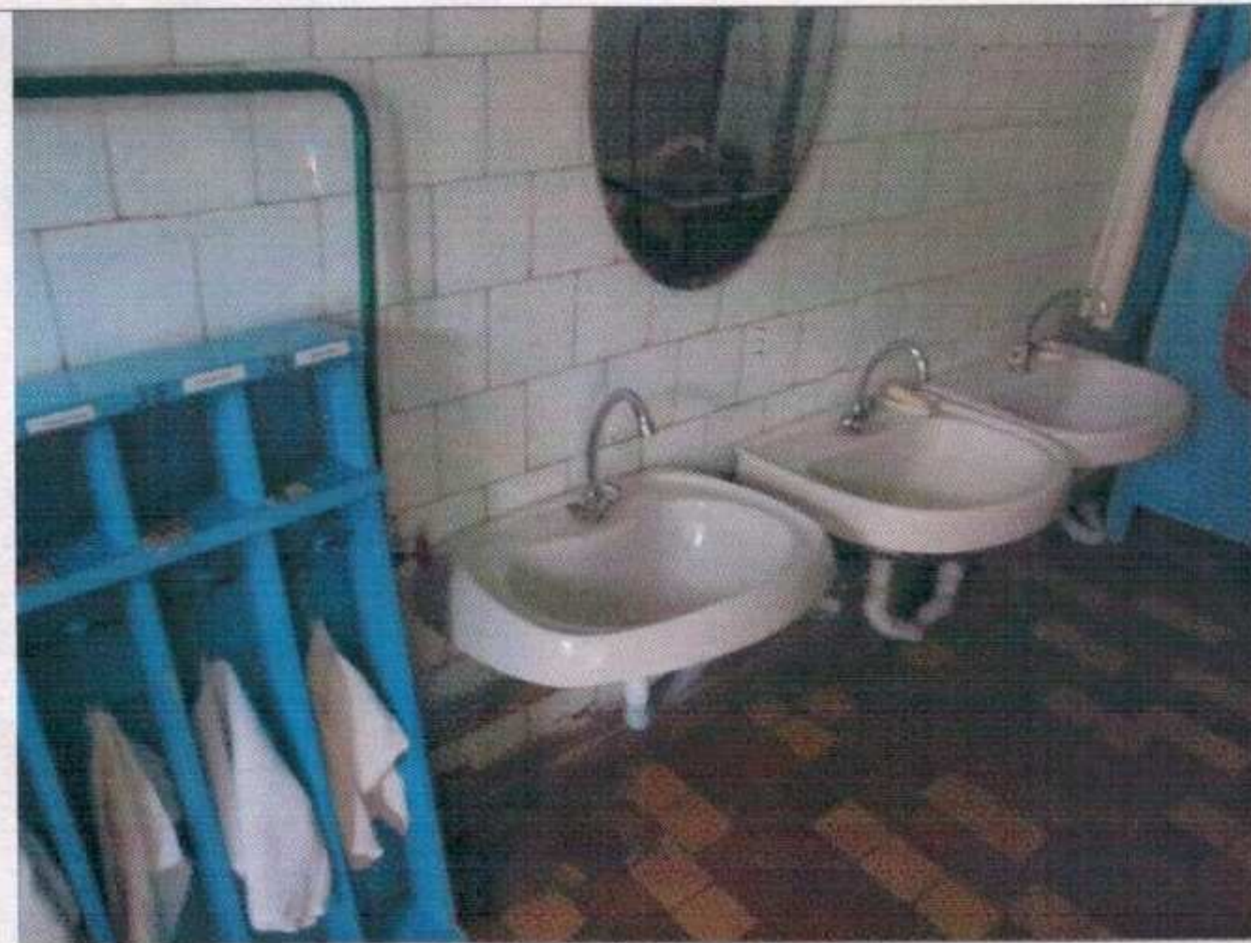
Фото №26 – Санитарно-гигиенические помещения