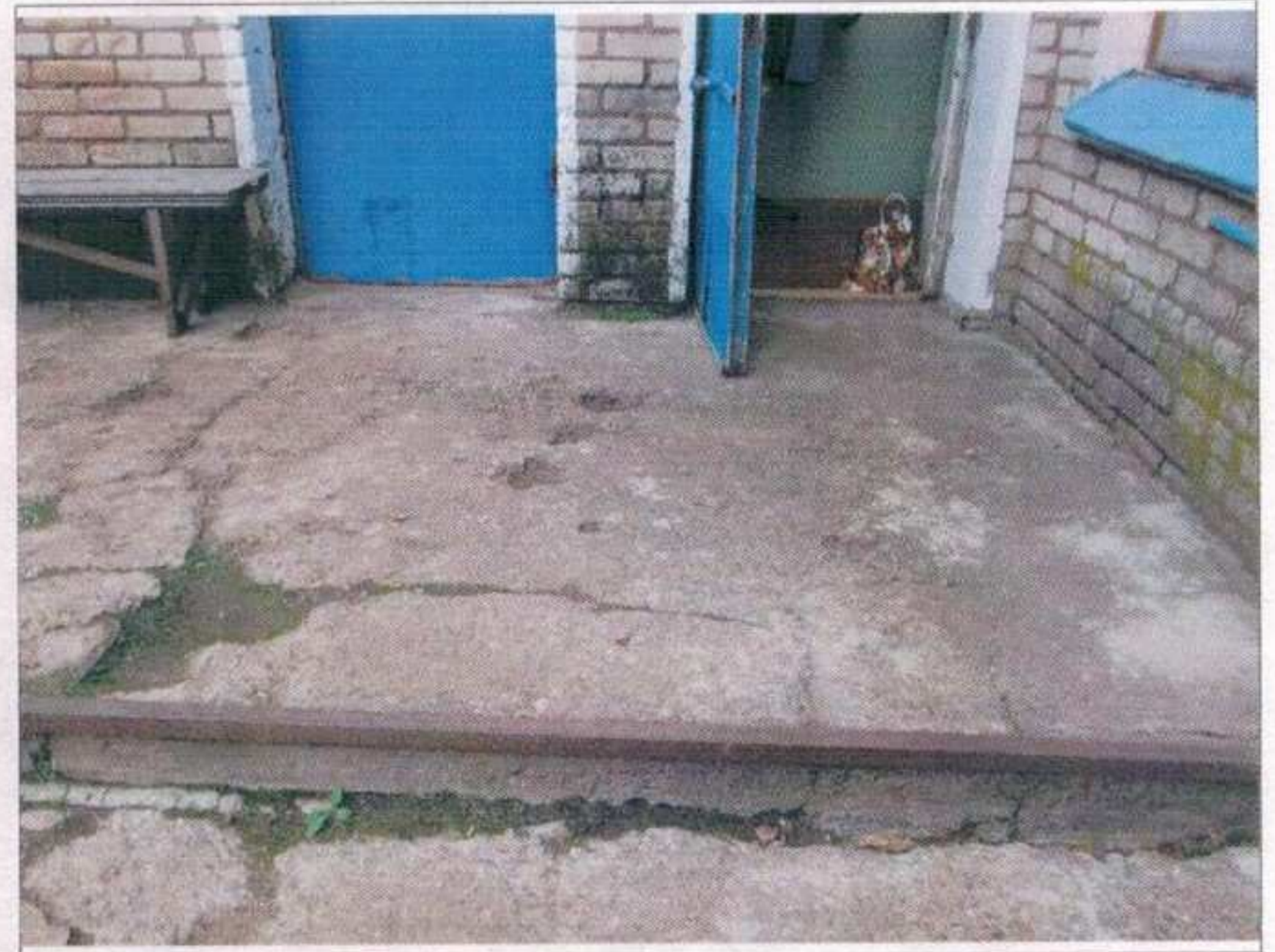
Фото №10 – Отдельный вход в группу расположенную на первом этаже. Входная площадка.