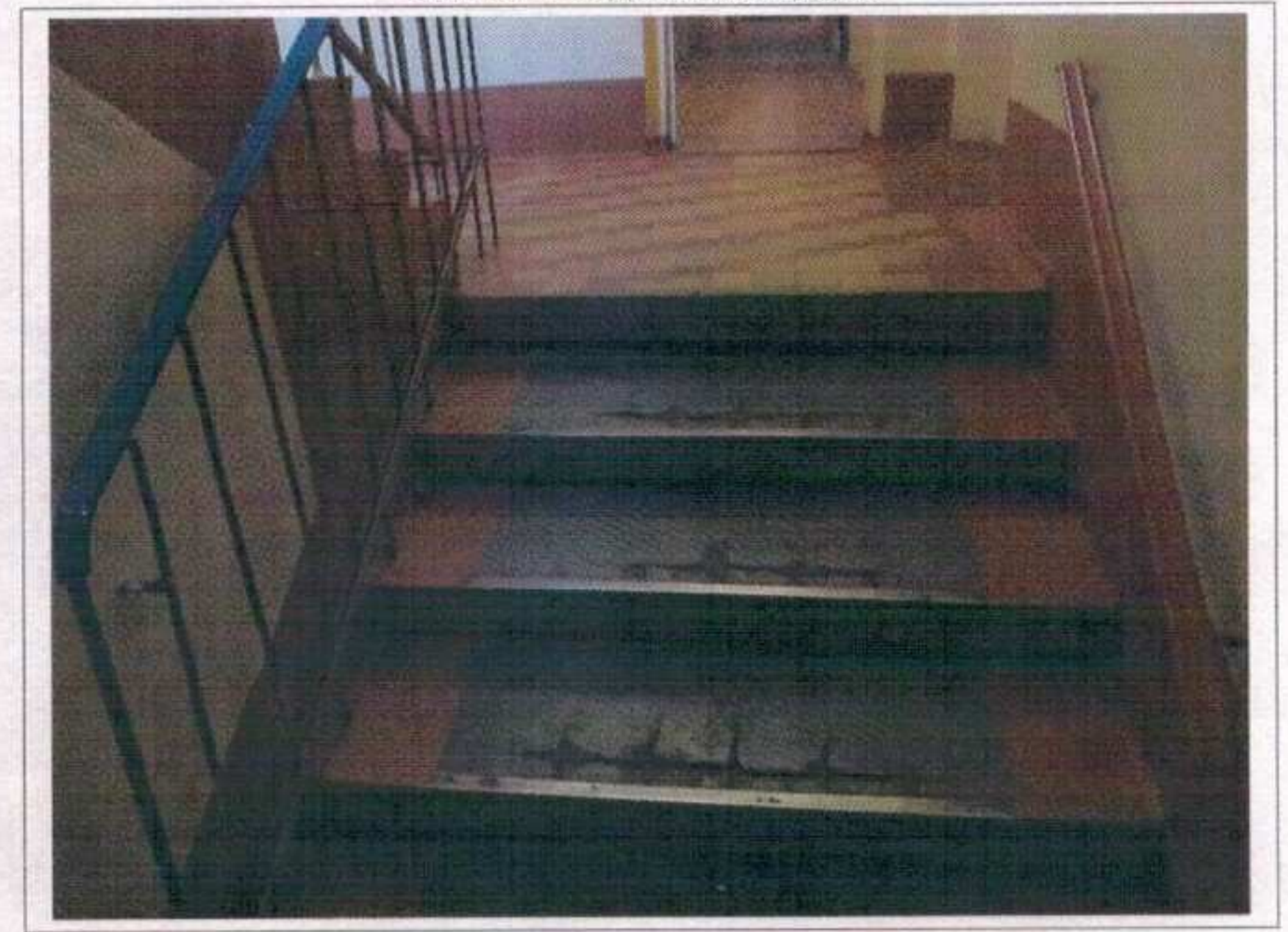
Фото №12 – Путь (пути) движения внутри здания (внутренние лестницы)